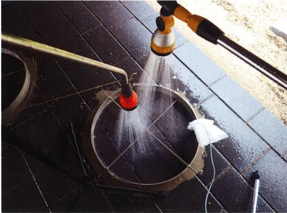
Bild: CityTruck 12 cm, Mixformen Typ D und E, Versuchsdurchführung