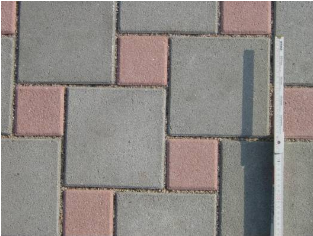
Bild 1: Pflastersystem Pasero Fuge 6,5 mm im Altdeutschen Verband